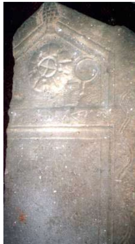
Сл. 3. Драчево

бол, таа го симболизира движењето на космосот, сонцето и небото, повторното раѓање. Симбол е на Севс, Хера, Хелиос, Артемида и др 5 . Нејзиното претставување на тимпаноните на стелите, секако е во врска со алузијата за вечен живот. Можеме да заклучиме дека третирањето на розетата на спомениците, од 1/2 на I в. до крајот на III в., стои во тесна врска со верувањето во задгробен живот т.е. во живот по смртта. Мајсторите каменоресци многу добро го познавале симболичното значење на розетата, затоа и не е случајно што, таа тука претставува главен, омилен и најброен декоративен елемент.