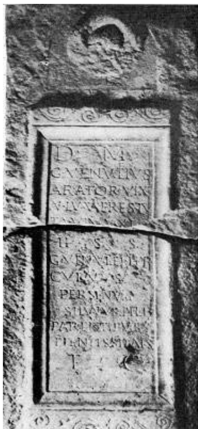
Сл. 7. Сопиште

рамки на композицијата посмртна гозба, со бисти на покојници, или во комбинација со розети, гирланди и сл. Тоалетната кутија претставувала дел од тоалетата на жените, во која чувале разни предмети-чешел, огледало и сл. Нејзината појава на стелите, укажува дека покојникот е жена, која и на оној свет сака да оди со предметите кои ги користела додека била жива.