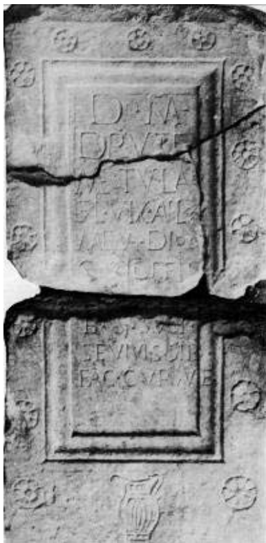
Сл. 2. Добри Дол

“rosalia” во староримскиот култ посведочен од I в.н.е., кој се празнувал меѓу 11 мај и 15 јули (во зависност од регионот), се кинеле лисја од рози. Императорите тогаш носеле круни од рози. Денес овој обичај во Италија се нарекува “domenica rosata” - недела на розите и се празнува во неделата на Духовите. Исто така, во гробовите во Рим, се ставале рози. Розета претставена во кружен облик го симболизира сонцето , кое е основен извор на творечката енергија. Тоа ја симболизира вечната младост, смртта и повторно раѓање, бесмртноста. Сончевите зраци (врезани плитко преку розетите), (сл.3) симболизираат небесни влијанија кои ги прима земјата. Сонцето има улога и на психомп, бидејќи секое утро се крева на небото, а навечер оди во подземјето. При тоа може да ги однесе луѓето во смрт, или да ги извлече душите од подземјето. Розетата која има облик на неправилна спирала т.е. комбинација на спирала и свастика, ја среќаваме на тимпаноните на стелите. Меѓу повеќето значења на спиралата се издвојува симболиката на времето, цикличните ритми на годишните времиња, на раѓањето и смртта, како и надежта за враќање од таму. Спиралата претставува динамичен систем, таа се движи од центарот, или кон него. Може да го симболизира и посмртното патување на душата, до нејзината крајна цел. Свастиката претставува најстар сим-