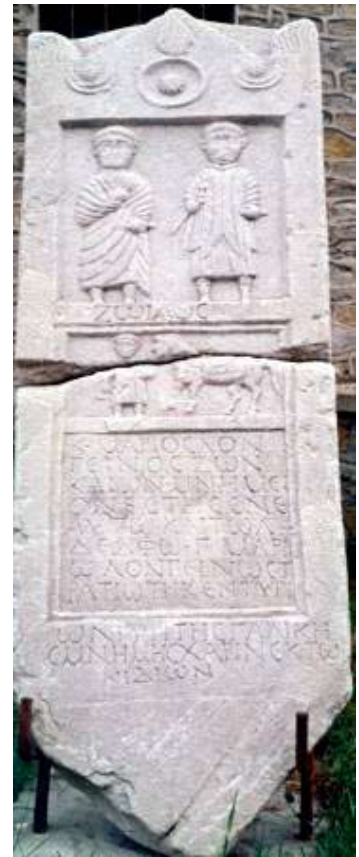
Сл. 5. Малино, Св. Николе

Боровата шишарка освен декоративно имала и симболично значење. Борот и боровата шишарка симболизираат бесмртност и долговечност и како такви играат важна улога во култот на мртвите. Затоа ова дрво се сади крај гробовите. Борот е симбол на Севс, а шишарката претставува еден од атрибутите на Дионис кој носел тирс (жезол), на чиј врв имал борова шишарка. Дрвото на борот