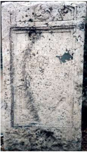
Сл. 4. Злокуќани

простор, или за декоративно украсување на надвратници и врати. Веројатно е, како што често се случува во процесот на формирање на уметничките претстави, одредена декоративна форма карактеристична за латинскиот ентериер дошла во спој со идејата за задгробни градини на изобилство и среќа, карактеристична за малоазиските и египетските погребни култови во кои на покојникот му се обезбедува место за одмор, освежување и уживање и дала симболично декоративен орнамент во облик на цветна гирланда. Дека идејата за вакви гробни градини била прифатена во римскиот свет, покажува изградбата на фамилијарни гробници градини во доцнорепубликанскиот и раноцарскиот период на територијата на Италија, со цел покојникот и на оној свет да има полно овошје и вино. 7