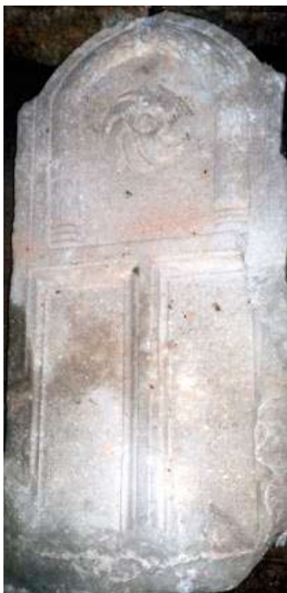
Сл. 6. Рашче

и за време на длабока старост е зелено и свежо, а шишарката симболизира мажевност, плодност и огин. Се поврзува со Артемида, Асклепиј, Јупитер, Венера, Дијана и Митра, 10 но и со Кибела, Атис, Сабазиј и Мен. 11