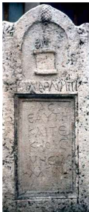
Сл. 10. Скупи