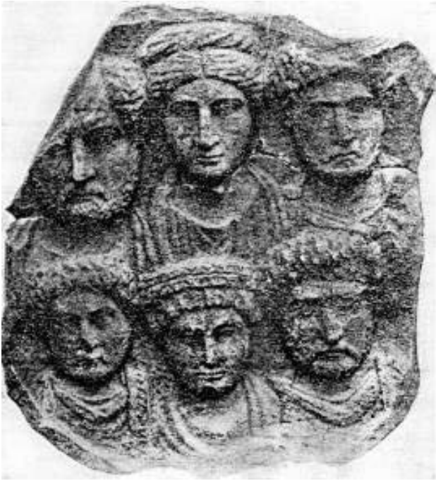
Сл. 12. Гевгелија - Дојран

Симболиката, овој орнамент (сл.12) го поврзува со постанокот на светот, создавачката моќ на светлината и периодичното обновување и враќање. 25