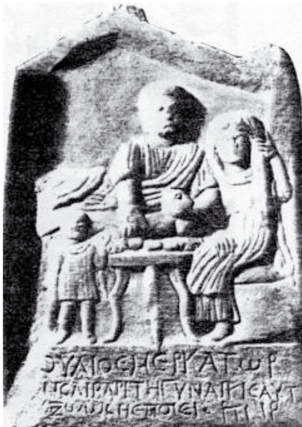
Сл. 9. Горна или Долна Сушица (Струма)

дејство, настан, циклус на непрекината регенерација. Врвовите на свастиката можат да бидат свртени кон лево и како такви да го симболизираат бесмртниот циклус на постоењето, или кон десно