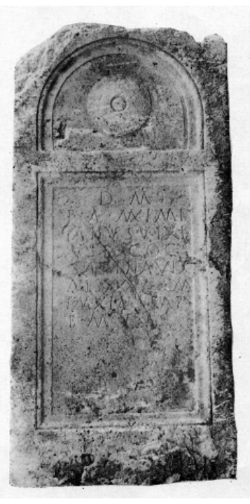
Сл. 11. Лојане

при што ја симболизира сончевата енергија и цикличното повторно раѓање. 17